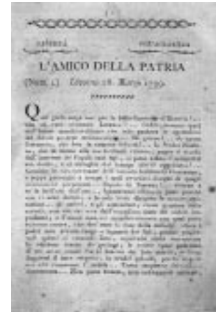
L'amico della Patria, primo numero

A un pubblico più esteso, appartenente in prevalenza alla media borghesia, si indirizza invece il “Magazzino italiano”, il periodico fonda-