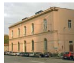
Sopra: L'edificio in cui è avvenuta la ristrutturazione dei locali