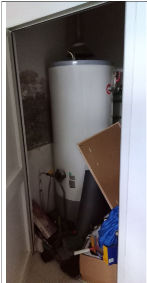
Accumulo ACS interno fabbricato spogliatoi