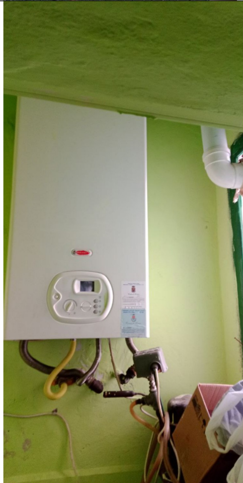
Caldaia locale tecnico