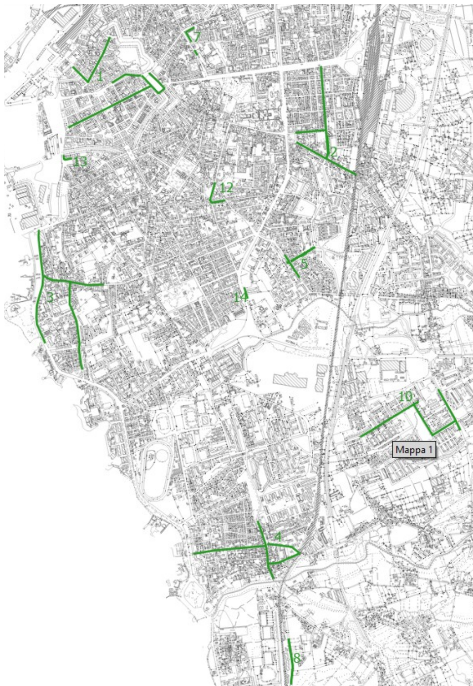
Tabella 2 – Mappa interventi proposti al Piano di Azione 2024

Aggiornamento PIANO DI AZIONE ai sensi del D. Lgs. 194/2005 - Aprile 2024